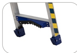
Sicherheitselement zum optimalen Anlehn an Ecken und Masten