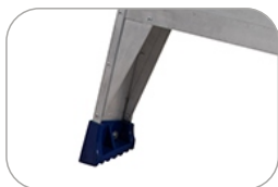
Kantenversteifung zur Vermeidung von Schäden an den Holmen