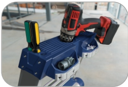
Integrierter Aufsatz mit Werkzeugbehälter und Magnetbereich