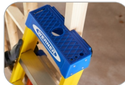
Einzigtiges Oberteil für jeden Anlehn-Modus, an und in Ecken und Masten