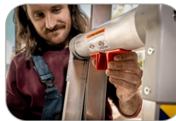
Patenterte Einhand-Verriegelung zum Moduswechsel