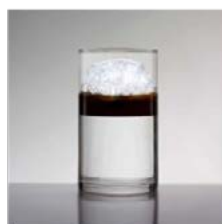
Disposer le coton magique sur l'eau