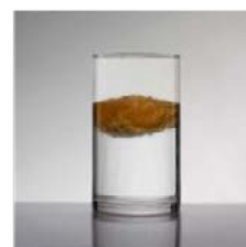
Attendre quelques instants