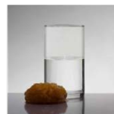
Retirer le coton magique