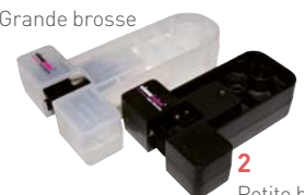
2 Petite brosse

Brosse pour ascenseur visant la lubrification des rails de guidage d'une largeur comprise entre 5 et 16 mm et d'une épaisseur pouvant aller jusqu'à 25 mm