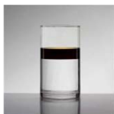
Eau avec de l'huile