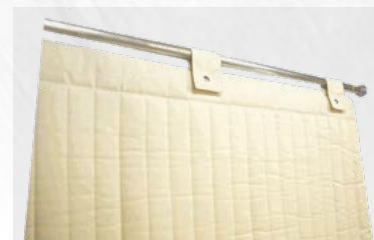
Rail télescopique pour le revêtement de la cabine