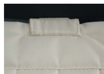
Aimant pour fixation au plafond