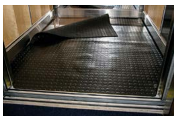
Protection du sol, fine