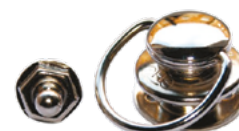
Bouton-pression avec oeillet Tenax